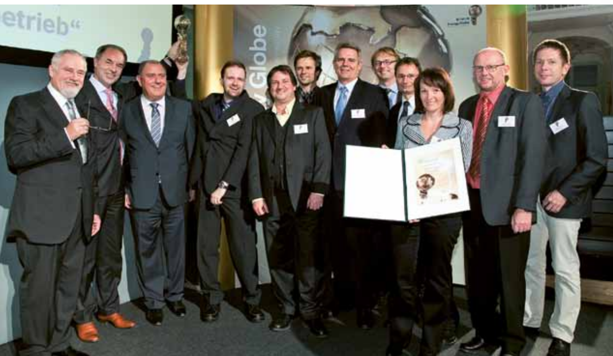
▲ Gruppenfoto der Preisverleihung Styria

Die Freude über die Auszeichnung und das Erreichte ist riesengroß. Nicht nur in ökologischer Hinsicht wurden Maßstäbe gesetzt, das neue Energiekonzept ist hoch wirtschaftlich und sichert zudem 50 Arbeitsplätze am Standort in Zeltweg. Durch die Summe aller Maßnahmen wurden 50 Prozent der Energiekosten eingespart.