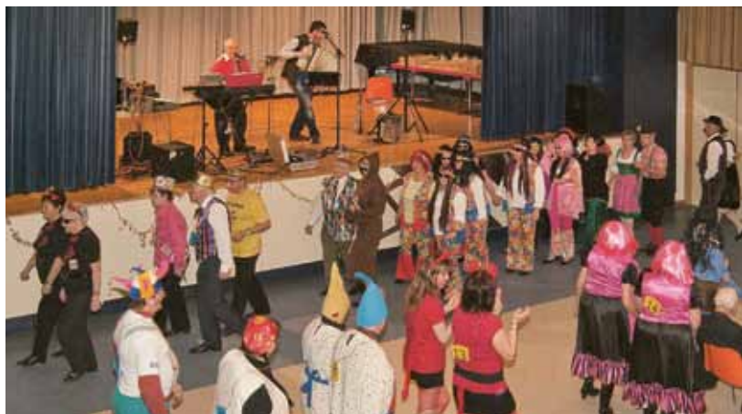
▲ Der Pensionistenverband Zeltweg ließ im Volksheim Zeltweg die Korken knallen

Für musikalische Unterhaltung sorgte das Duo K2. So konnten die Maskierten nicht nur auffallen, sondern auch das Tanzbein schwingen.