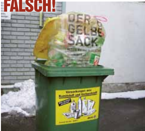
▲ Gelbe Säcke gehören nicht in die Gelbe Tonne!