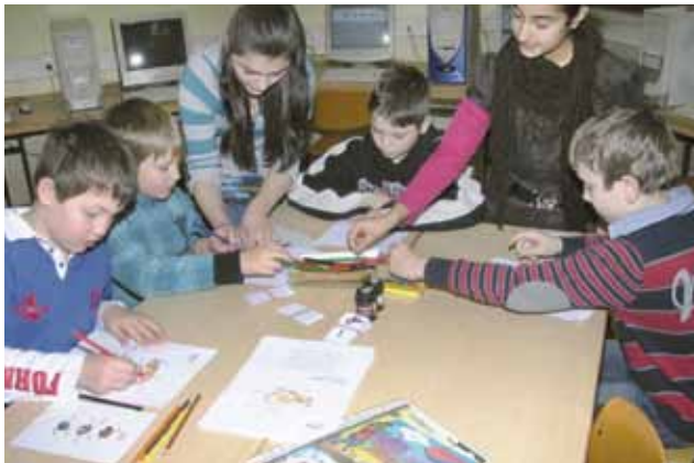
▲ Freude am Lernen ist ein wichtiger Punkt in der „Neuen Mittelschule“

■ An der HS Zeltweg werden durch den Schulversuch „Vermehrte Förderung unter Berücksichtigung der Differenzierung und Individualisierung“ und der Führung von Notebookklassen bereits jetzt viele Inhalte der „Neuen Mittelschule“ umgesetzt. Bei einer kürzlich stattgefundenen Befragung haben sich nun sowohl das Lehrerkollegium als auch die überwiegende Mehrheit der Eltern für eine Umwandlung der HS in eine „Neue Mittelschule“ ausgesprochen. Der Antrag, der darüber entscheiden wird, wann die Hauptschule Zeltweg zur neuen Schulform wird, wurde bereits beim Landesschulrat für Steiermark eingebracht.