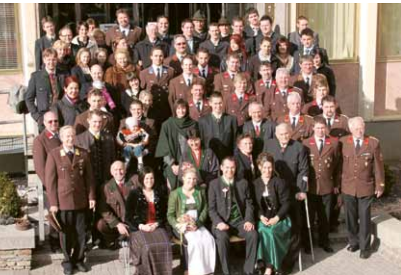
▲ Chic: Feuerwehrhochzeit bei der FF Farrach