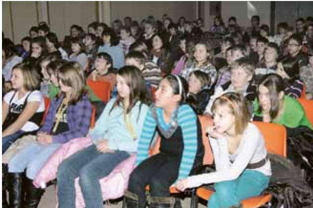
▲ Das Theater am eigenen Leib konnten die Schüler der HS Zeltweg kürzlich im Volksheim Zeltweg spüren. Die Theatergruppe „Forum Theater“ brachte eine kindgerechte Inszenierung des „Zerbrochenen Kruges“ von Heinrich von Kleist auf die Bühne.