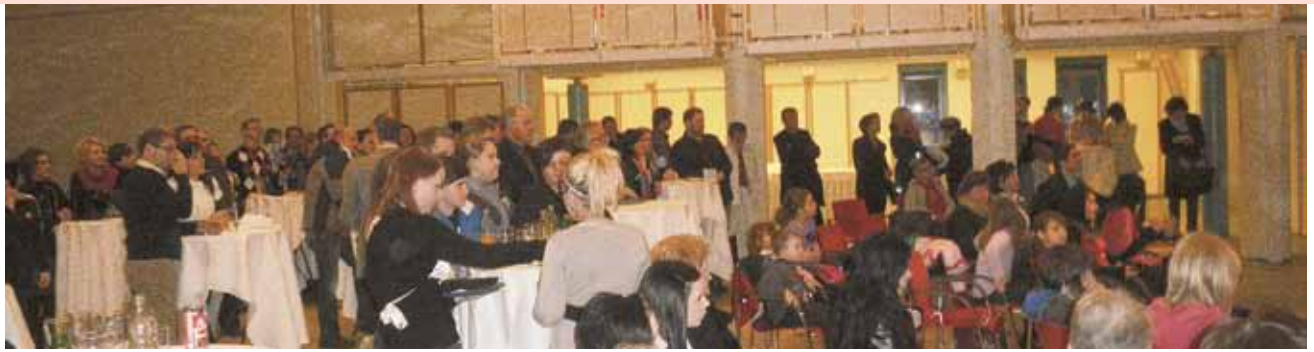
▲ Breaking Limits: eine super besuchte Veranstaltung