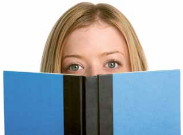
▲ Lesen ist Abenteuer im Kopf