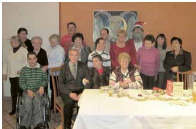
▲ Weihnachtliche Stimmung im Gasthaus Dorfschenke Galler