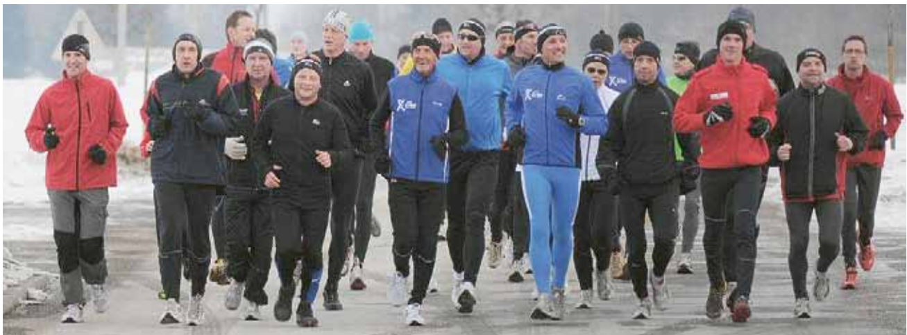
▲ 148 Läufer trotzten der Kälte beim zehnten Zeltweger Silvesterlauf

Unterhaltsam wurde es im Rahmen des Weihnachtsgewinnspiels des Zeltweger Tourismusvereins. Gutscheine im Wert von 1.800 Euro erfreuten die zahlreichen Gewinner.