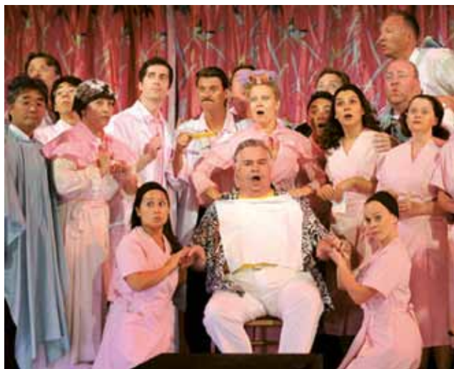
▲ Der Vogelhändler besticht in drei Akten