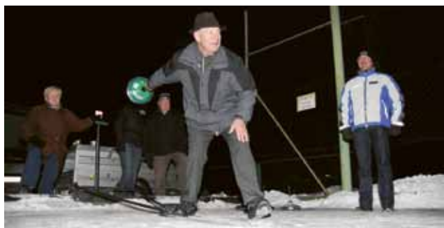
▲ Gut bei Schuss, die Wanderer

Auf der Stocksportanlage des ESV-Zeltweg stellten sich wieder acht Moarschaften aller Referate einem Vergleichskampf. Spannend, aber fair waren die Partien bis zum Ende. Sieger konnte es aber nur einen geben.