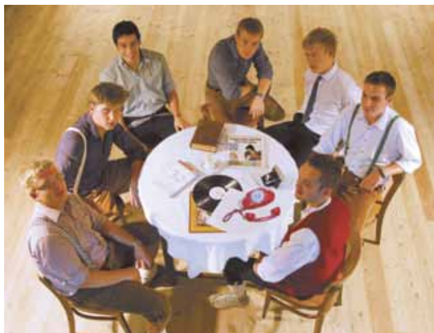
▲ Federspiel unterhalten mit Märschen, Walzern, Jodlern und Zitherklängen

Die Stadtgemeinde Zeltweg lädt am 7. Mai 2011 ab 16:00 Uhr erstmals zur Muttertagsfeier ins Volkshaus ein. Für musikalische Unterhaltung sorgt das Volksmusikensemble Federspiel mit seinem Repertoire rund um Polkas, Walzer und Märsche. Zur Musik von Federspiel gehören aber auch Arrangements traditioneller mexikanischer Musik, Stücke mit der Zither als Soloinstrument oder Jodler von der Großmutter. Alle Zeltweger sind herzlich eingeladen, bei freiem Eintritt eine wundervolle Muttertagsfeier zu erleben.