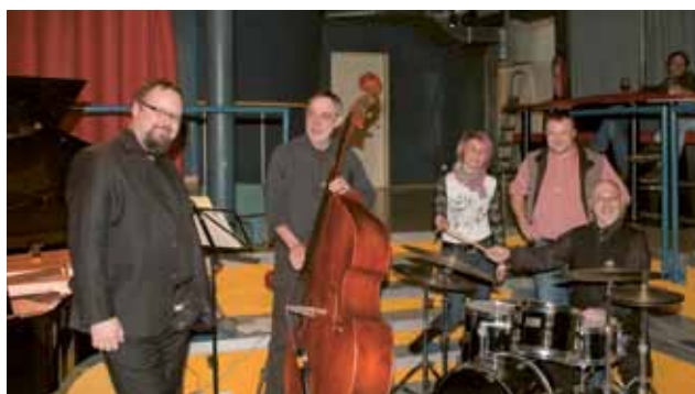
▲ „THREE(o) GENERATIONS“ sorgten im Jänner für Unterhaltung

Die Abende beginnen jeweils um 20:00 Uhr im Theater im Keller. Kommen Sie vorbei!