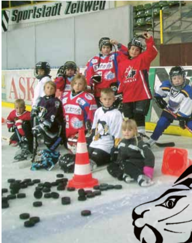
▲ Die jungen Eishockeycracks sind mit Begeisterung bei der Sache