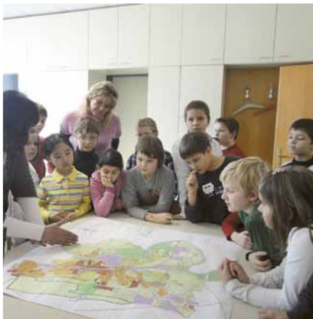
▲ Die Klasse 3 d zu Besuch im Stadttamt Zeltweg

Der Bürgermeister und der Stadttamtsdirektor beantworten Fragen und die Kinder können ihre Wünsche loswerden. Anschließend steht der Besuch der einzelnen Abteilungen im Stadttamt auf dem Plan. Hier bekommen die jungen Zeltweger Einblicke in die Arbeit der Mitarbeiter. Zum Abschluss gibt es auf Wunsch der Kinder eine Kindertrauung. Diese findet allerdings nicht immer statt, da es meistens an heiratswütigen jungen Paaren mangelt. Als Erinnerung an den interessanten Tag bekommen die Schüler noch ein kleines Geschenk.