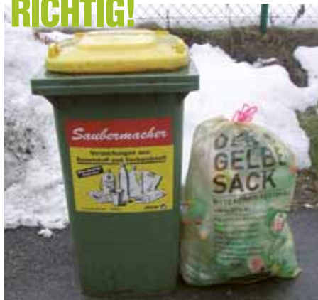
▲ Sack und Tonne sind abholbereit