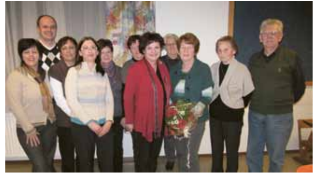
▲ Die neuen Ausschussmitglieder der Volkshilfe Zeltweg

WIR SIND GERNE FÜR SIE DA Tel.: +43 (0) 3578 / 365 50-40 Wiesenweg 5, 8742 Obdach www.pflegewohnheim-zirbenland.at