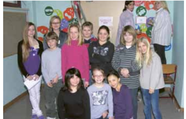
▲ Am 27. und 28. Jänner standen die Pforten der HS Zeltweg für die Schüler der 4. Klasse der VS Zeltweg und ihre Eltern weit offen. Die Besucher waren vom vielfältigen und interessanten Lern- und Ausbildungsprogramm begeistert.