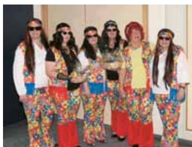
▲ Yeah, die Hippies sind gelandet