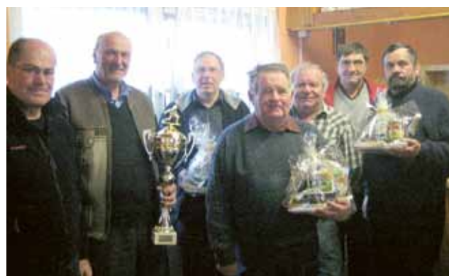
▲ ÖKB Steiermark heimste bei den Männern den Meisterpokal ein