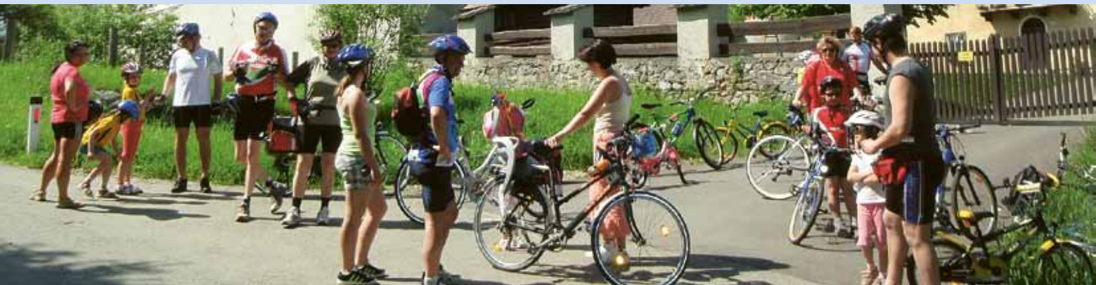
▲ Viele Radfans genossen bereits in der Vergangenheit den Zeltweger Radtag