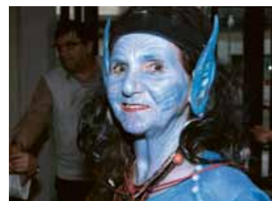
▲ Von welchem Planeten kommt wohl diese hübsche Dame?