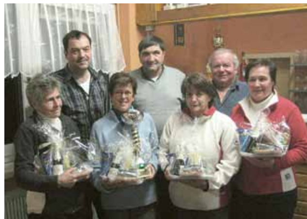
▲ Die neuen Stadtmeisterinnen im Eisstockschießen