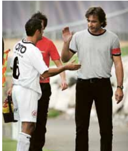
▲ Der Trainer ist zufrieden!

Weitere Infos erhalten Sie im Frühjahrsfolder des FC Zeltweg. Gespickt mit Daten, Fakten und Meinungen – und das alles zum Nulltarif!