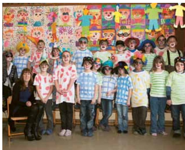
▲ Clowns im Klassenzimmer