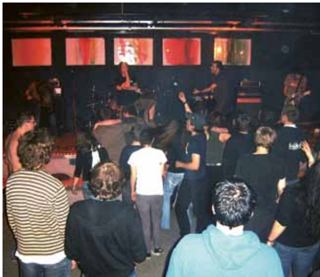
▲ Bands Downstairs