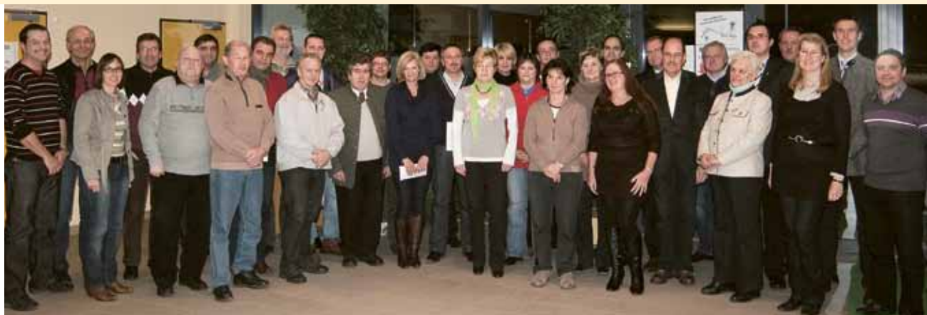
▲ Für Zeltwegs Vereine wurden wieder Sponsorgelder zur Verfügung gestellt