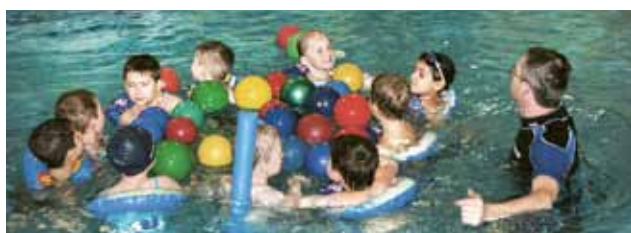
▲ Ein Schwimmkurs bei den Naturfreunden macht Spaß

gesamt 30 Kindern abgehalten werden. Gratulation allen Kindern für das Erreichen des ersten Schwimmabzeichens. Hurra, die Badesaison kann kommen!