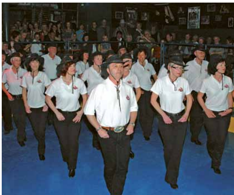
▲ Countryfeeling im Theater im Keller

Bekannt geworden ist der Linedance durch die Country- und Westernmusik. Er hat sich mittlerweile in sämtlichen Musikrhythmen und -richtungen durchgesetzt und begeistert vor allem die Jüngeren und Junggebliebenen.