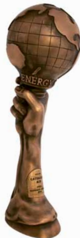
▲ Der Pokal als Blickfang