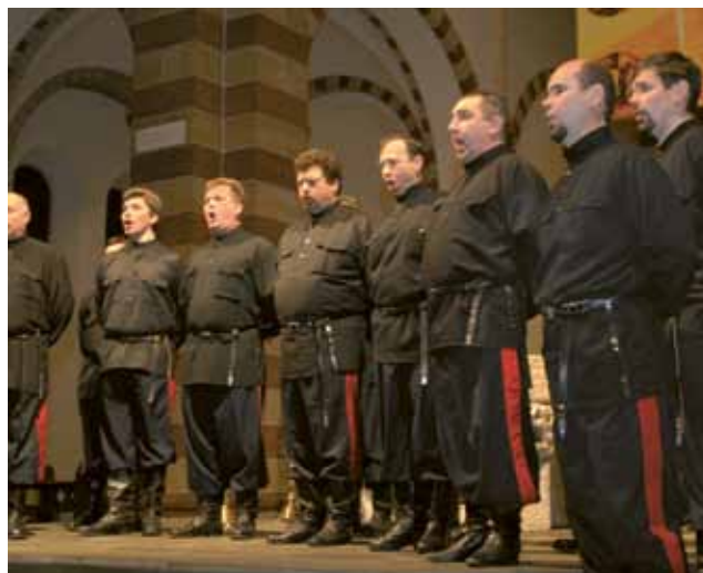
▲ Imposante Erscheinung: der Don Kosaken Chor