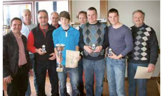
▲ Der Pokal ging an den Titelverteidiger FF Farrach