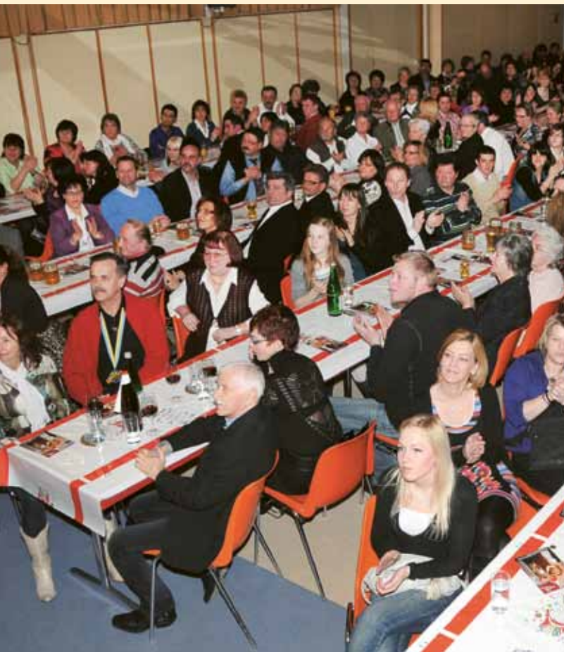
▲ Bla, bla im gutbesuchten Volksheim Zeltweg