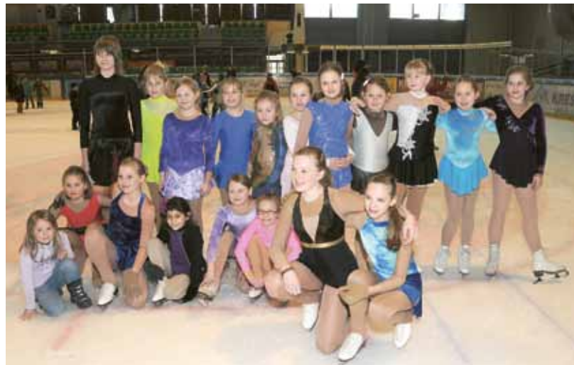
▲ Gruppenbild der Mitglieder des EKAZ

Damit die Leistungen auf so hohem Niveau bleiben, findet ab April wieder das wöchentliche Trockentraining statt. Im August steht das Sommercamp in der Aichfeldhalle auf dem Plan. Bedanken möchte sich der EKAZ beim Sportzentrum Zeltweg für die gute Zusammenarbeit und die tatkräftige Unterstützung.