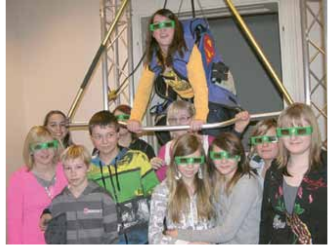
▲ Besuch im Haus der Wissenschaft

Ü ber ein außergewöhnliches Musikerlebnis freuten sich die Kinder der dritten und vierten Klasse der Hauptschule Zeltweg. Zwei Frauen vom Mozart-Ensemble Luzern waren am 21. Mai 2010 zu Besuch und stellten ihr Können unter Beweis. Auf der improvisierten Bühne der Aula gaben die Künstlerinnen Strawinskys „Feuervogel“ zum Besten. Die Kinder waren von der ausgefallenen und fremden Darbietung der Pianistin und der Tänzerin beeindruckt. Spaß machte vor allem das Mittanzen, Mitsingen und Zuhören.