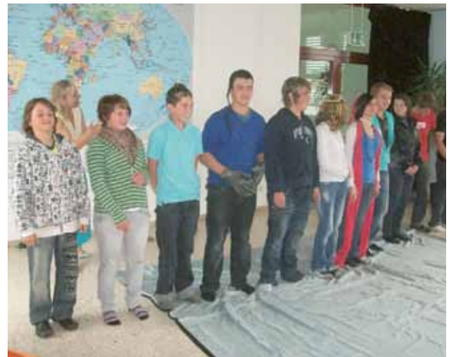
▲ Die Kinder der HS Zeltweg beim Mitsingen und -tanzen

Es war für alle Beteiligten ein großartiger und interessanter Ausflug, den die Schüler nicht so schnell vergessen werden.