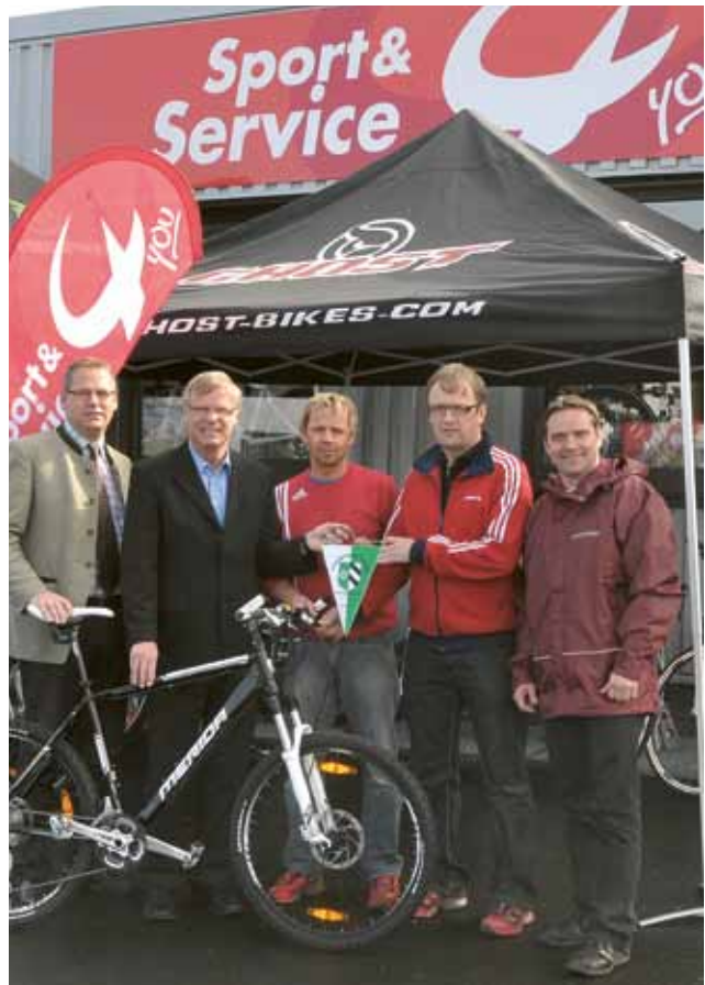
▲ Beste Beratung: das Fachpersonal von „Sport&Service4you“

Alle Tennisfreunde kommen in der Tennisabteilung auf ihre Rechnung – vom Schläger bis zur passenden Bekleidung. Auch ein Bespannservice steht den Kunden zur Verfügung. Geöffnet hat „Sport&Service4you“ montags bis freitags von 9.00 bis 12.00 Uhr und 14.30 bis 18.00 Uhr und samstags von 9.00 bis 12.00 Uhr.