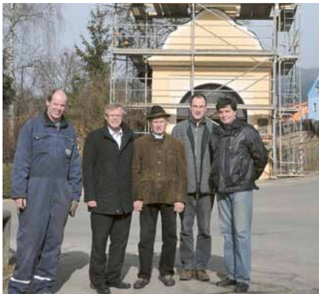
▲ Nun hat die Glocke ein uhrgesteuertes Schlagwerk