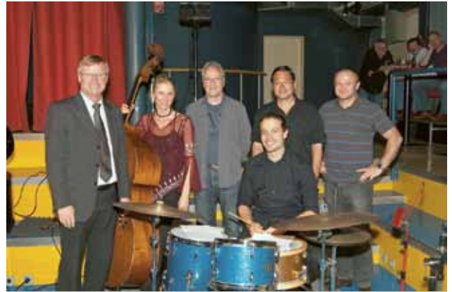
▲ Die „zusammengewürfelte“ Band