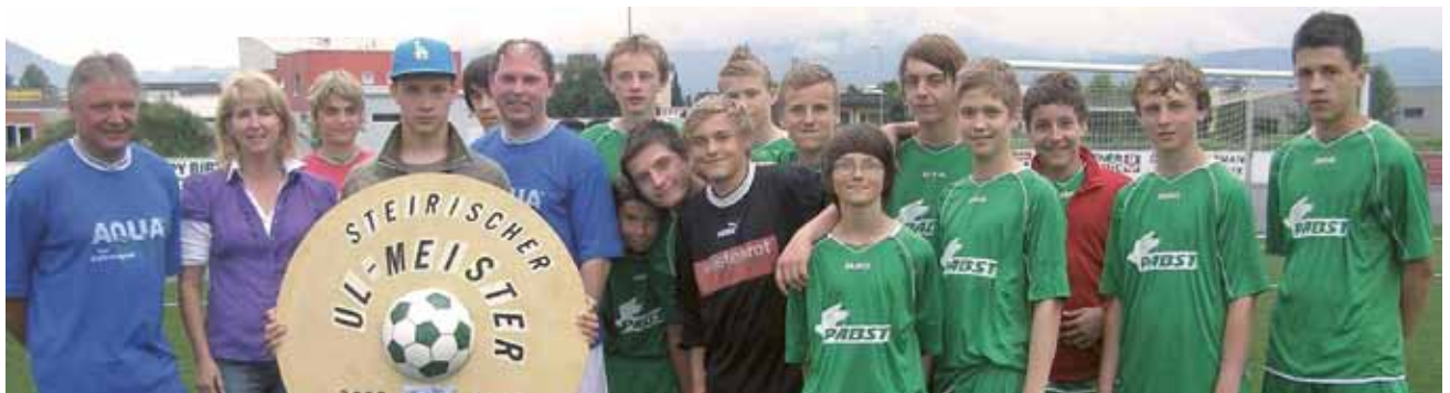
▲ Die steirischen Meister ins rechte Licht gerückt

Zur 90-Jahr-Feier des FC Zeltweg ist am 17. Juli ab 9.00 Uhr ein Jugend- und Kleinfeldturnier für Hobbymannschaften geplant. Auf dem Programm steht auch eine große Bilderausstellung im Foyer der Zeltweghalle. Alle Zeltweger sind herzlich eingeladen, sich das neue Stadion anzuschauen. Dort können sie sich auch die Vereinschronik mit 100 Seiten Fußballerinnerungen bei den Funktionären holen.