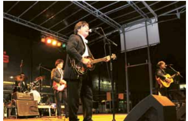
▲ The Beatles Double Group in Höchstform