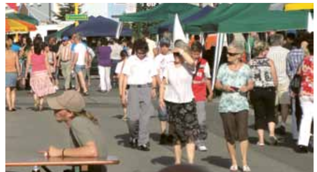
▲ Herrliches Wetter und tolle Musik – was will man mehr?