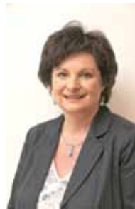
GR Brigitte Konrad (SPÖ)