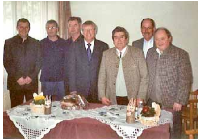
▲ Die Vertreter der Stadtgemeinde Zeltweg mit Funktionären des ST50 Zeltweg

Von 9. bis 10. Oktober 2010 lädt der Kleintierzuchtverein alle Zeltweger zur Kleintierausstellung in den Mehrzwecksaal Hetzendorf ein.