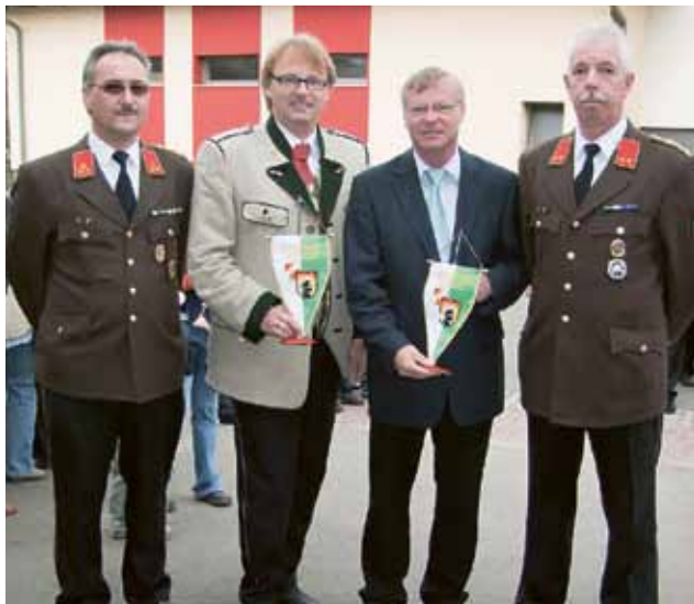
▲ Überreichung des Ehrenwimpels für die gute Zusammenarbeit