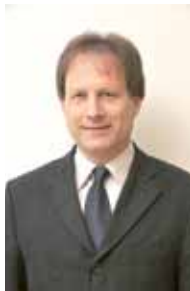
GR Siegfried Simbürger (SPÖ)