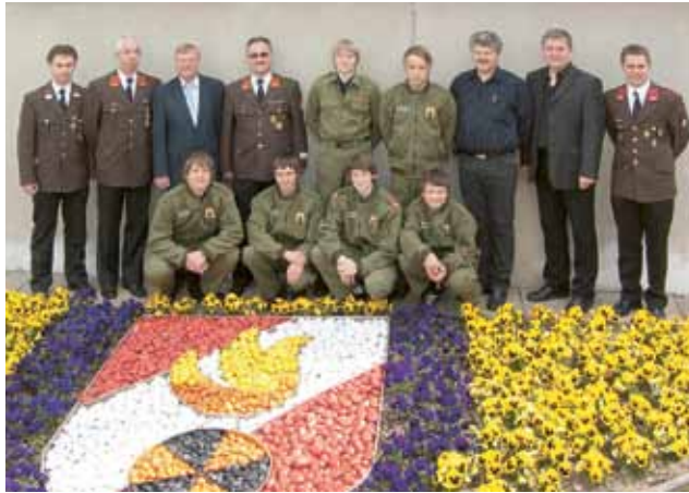
▲ Die Feuerwehrjugend mit Kommando und Ehrengästen