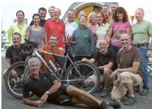
▲ Das Siegerfoto mit Heinz Fischer