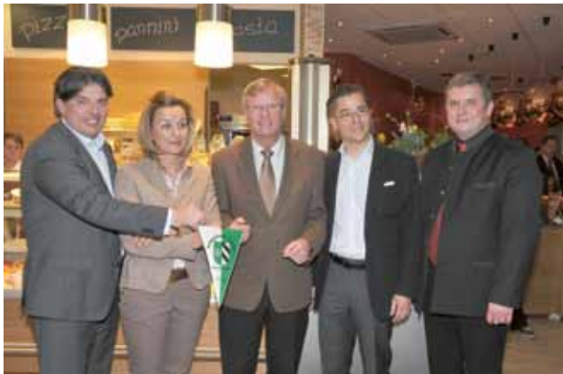
▲ Genießeria Papapico hat seine Pforten geöffnet