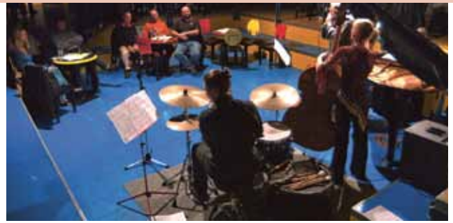
▲ Swing beim Blue Monday

Die abwechslungsreichen Arrangements und die bewusst auf die Mundharmonika abgestimmte Instrumentierung kamen im Kellertheater besonders gut zur Geltung. Die Instrumentierung, das Zusammenspiel und die Harmonie waren eine große Herausforderung für die Musikanten, die diese Situation spielerisch meisterten.