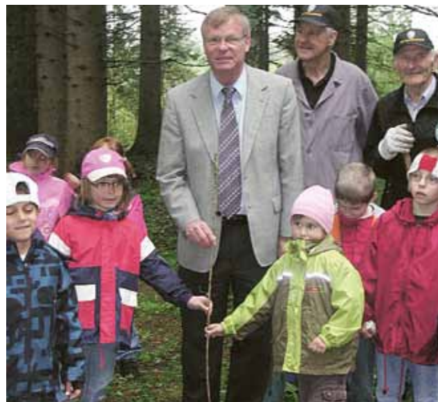
▲ Jedem Kindergartenkind sein eigenes Bäumchen

R und um den Waldlehrpfad erblüht neues Leben. Die Kinder des Kindergartens I haben gemeinsam mit der Bergwacht 110 Bäumchen gesetzt. Besonders stolz waren die Kinder, als die Bäumchen ein Namensschild des jeweiligen Kindergartenkindes umgehängt bekamen. Insgesamt wurden in letzter Zeit 900 Laubbäume gesetzt, die rund 100 verschiedenen Vogelarten Nistplatz bieten. Die gepflanzten Ebereschen, Linden, Vogelkirschen und Eichen sorgen für die Aufrechterhaltung des Mischwaldes. Auch das Wild freut sich über den Neuzugang auf dem Waldlehrpfad. Nach getaner Arbeit tankten die Kinder bei einer Jause Energie.