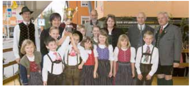
▲ Auch die Kleinen feierten ihre tollen Leistungen