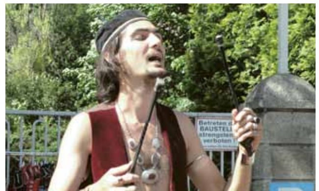
▲ Arabisches Flair auf dem Stadtfest: Ein Fakir zeigt sein Können