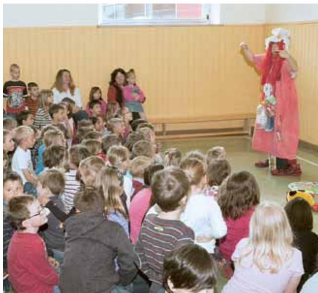
▲ Mit der Müllhexe Rosalie wurde das Thema Mülltrennung zum Kinderspiel

D ie Umwelt geht uns alle an. Um den Kindern so früh wie möglich ein Bewusstsein für saubere Umwelt mitzugeben, startete der Abfallwirtschaftsverband Judenburg ein Projekt zum Thema Abfall. Das Projekt ging im Rahmen der Schul-Erlebnis-Tage vom 17. bis 20. Mai in der VS Zeltweg über die Bühne. Müllhexe Rosalie war mittendrin, als im Turnsaal der VS Zeltweg das Thema Mülltrennung auf dem Lehrplan stand. Die Schüler lernten außerdem wichtige Dinge über die Kompostierung. Dabei halfen ihnen Schmatzi der Kompostwurm und seine Freunde. Abschließend vertieften die Kinder ihr Erlernetes bei einer Exkursion zum Altstoffsammelzentrum.