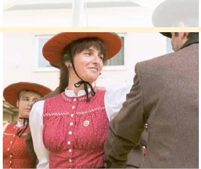
▲ Fesche Madl und stramme Burschen beim Verbandswertungstanzen

Der Platzmarkt in Zeltweg war am Pfingstsonntag wieder kulturelle Bühne. Die besten steirischen Vereine trafen sich zu einem Verbandswertungstanzen im Ortszentrum. Dazu eingeladen hatte der Verband der Heimat- und Trachtenvereine Oberes Murtal. Schon zu Beginn knallte es ordentlich, als der Trachtenverein Steirerherzen aus Knittelfeld die Peitschen über die Zuschauer schmalzen ließ. Dann zeigten die Kindertanz- und -plattlergruppen, was sie drauf haben. Von schmissig bis graziös die zahlreichen Erwachsenengruppen. Alle Darbietungen wurden von geschulten Augen beobachtet und bewertet. Beim Kinderantzen räumte der TV Almrausch Semriach ab, beim Kinderplatteln war der TV Schraubkogler Gratkorn unschlagbar. Der TV Steirerherzen Graz wurde sowohl beim Erwachsenentanz als auch beim Platteln Erster.