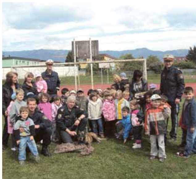
▲ Zu Besuch bei unserem Freund und Helfer