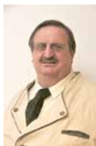
2. Vizebürgermeister Helmut Ranzmaier (ÖVP)