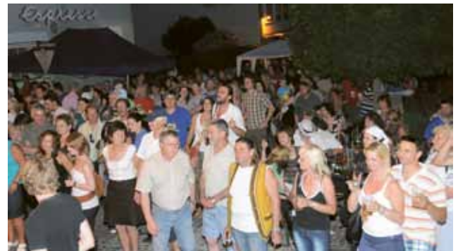
▲ Das Stadtfest war sehr gut besucht