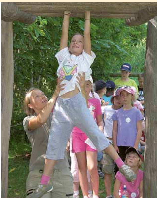
▲ Klettern wie ein Affe

Weitere Infos unter 03577/22411 oder unter naturfreunde.zeltweg@gmx.at .