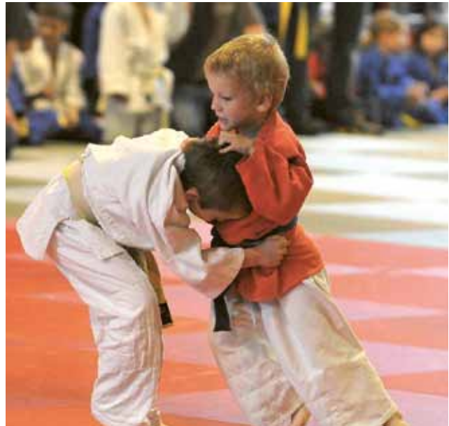
▲ Junge Judoka zeigen ihr Können

Bedanken möchte sich das Judoteam Zeltweg bei allen Mitarbeitern, ohne deren Hilfe das Turnier in dieser Größenordnung nicht durchzuführen gewesen wäre. Besonderer Dank gilt jenen Mitarbeitern, die keine Vereinsmitglieder sind oder deren Kinder keine aktiven Judoka mehr sind. Sie unterstützen das Judoteam Zeltweg weiterhin, was keine Selbstverständlichkeit ist!