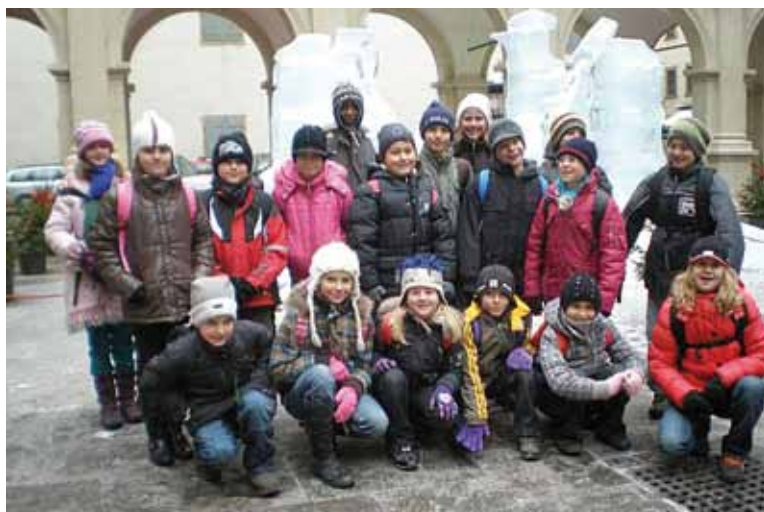
Die 4. Klassen besuchen die Landeshauptstadt unter dem Motto lerne dein Bundesland kennen.