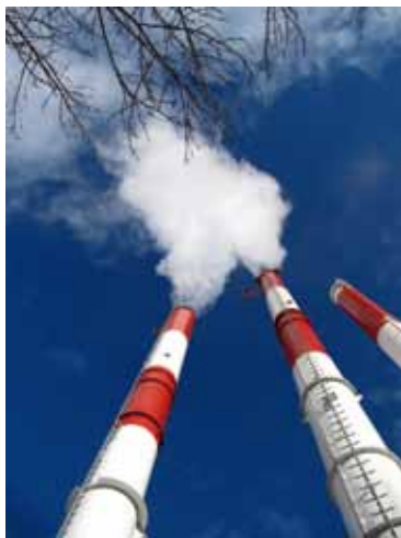
Kaminanlage mit Wasserdampf.

Im Jahr 2009 wurde daher das Biomasse-Heizwerk II errichtet. Die Betonbauarbeiten wurden, wie auch schon für den ersten Bauabschnitt, von der Fa. Kaltenegger Bau aus Aichdorf ausgeführt. Nach sehr kurzer Bauzeit von nur 6 Monaten konnte nun auch der zweite Biomassekessel mit 12.000 kW Leistung in Betrieb gehen.