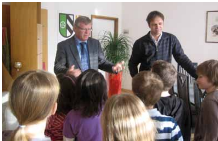
Die 3. Klassen besuchen das Stadtamt unter dem Motto lerne deinen Bezirk kennen.