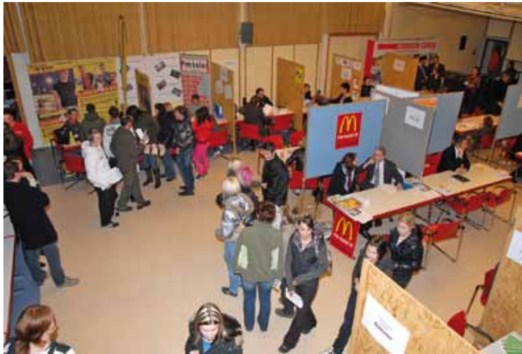
Ein toller Event mit zahlreichen begeisterten Besuchern.

Junge Leute aus dem Aichfeld bekommen eine Top-Job-Chance bei der dritten Lehrstellenbörse im Volksheim Zeltweg