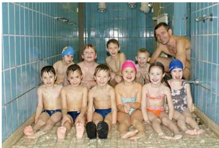
Mehr als 50 Kinder haben erfolgreich schwimmen gelernt.

Die traditionellen Schi- und Snowboardtage für Anfänger und Fortgeschrittene konnten in der ersten Januarwoche trotz fehlender Winterpracht erfolgreich beim Schizentrum Gaal durchgeführt