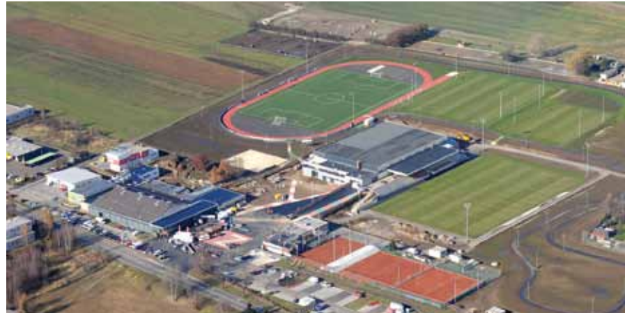
Sportzentrum Zeltweg einst...