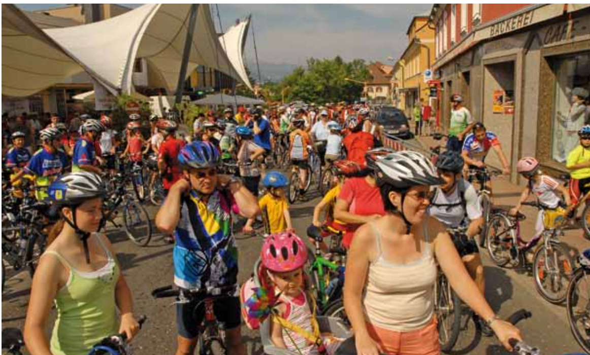
Zahlreiche Teilnehmer starten im Vorjahr erstmals vom Platzmarkt.