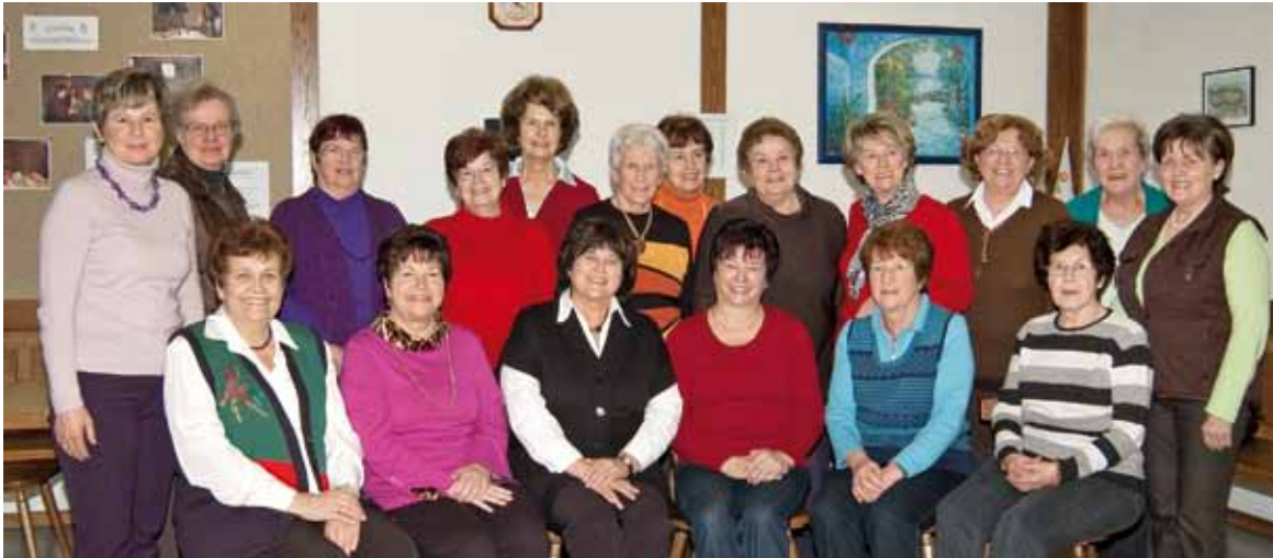
Die beiden Obfrauen (Bild Mitte) mit 16 Damen ihrer aus 24 aktiven Mitglieder bestehenden Gruppe!