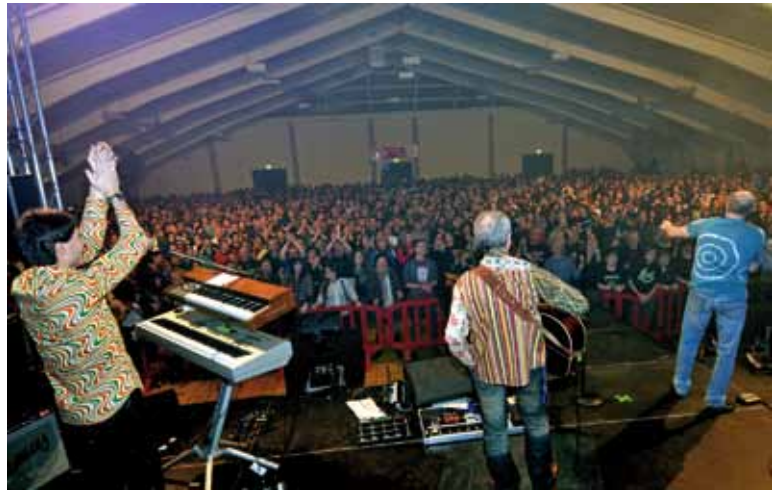
Tolle Stimmung in der Zeltweg-Halle.

Am 26. Dezember gelang es den ROARING SIXTIES & friends in der ausverkauften Zeltweger Tennishalle ihr Publikum mit den größten Hits der Rock- und Pop-Geschichte zu begeistern. Rockige Gitarren-Klänge, eine effektvolle Lichtshow und vorbei fliegende Visualisierungen auf einer übergroßen Leinwand - eine stärkere Eröffnung konnte man sich für diese Rock-Nacht kaum vorstellen. Und dieses Konzert hatte viel Sehens- und Hörenswertes zu bieten. Das Organisationsteam Pirker-Roth-Obermaier-Koiner landete wieder einen Volltreffer. An erster Stelle sei natürlich das Monsterprogramm von 54 Superhits genannt, die stilschlecht über die Bühne gebracht wurden. Die Atmosphäre dieses Abends und die