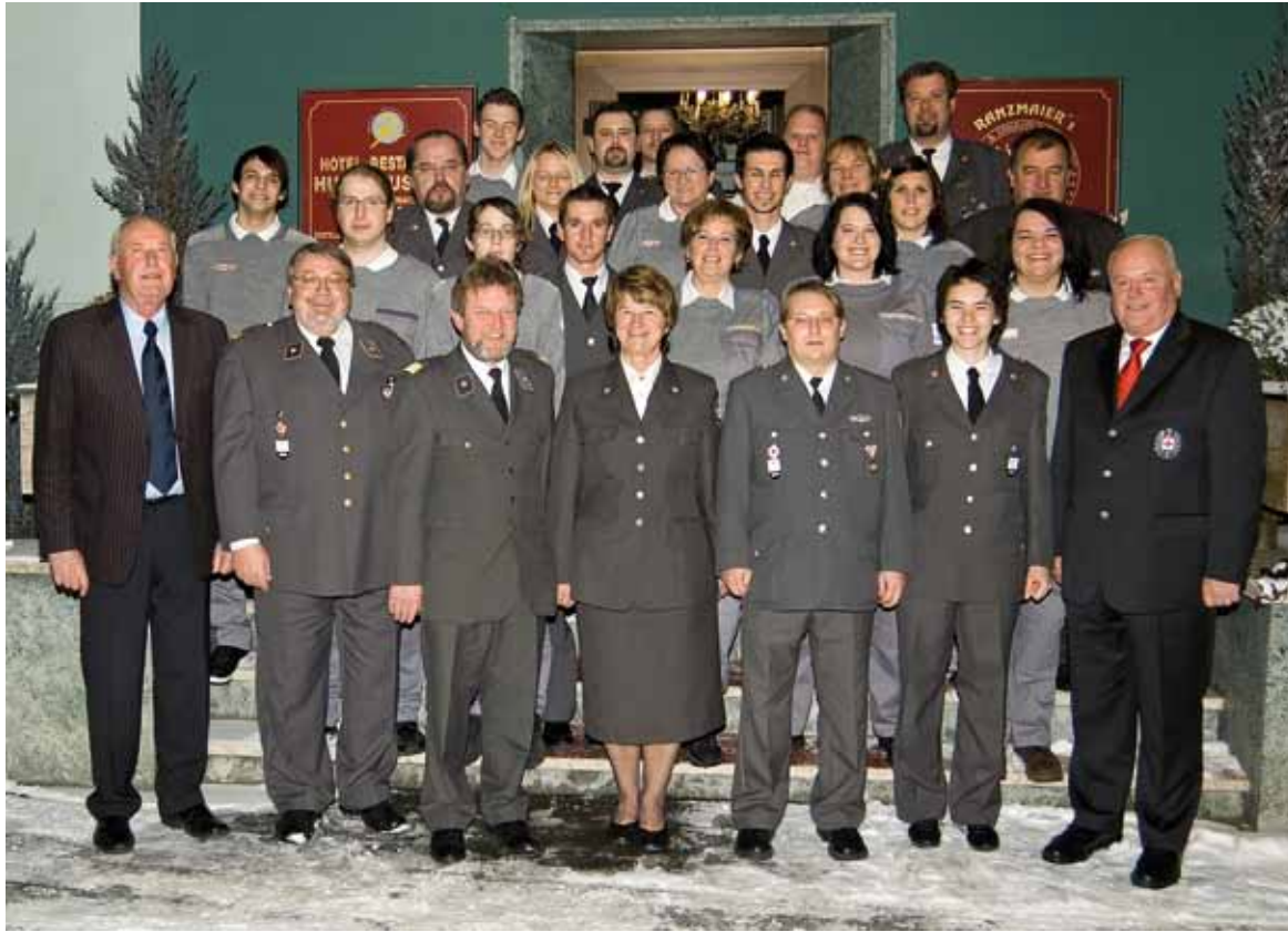
Team der Rot Kreuz Stelle Zeltweg.

Der jährliche Kameradschaftsabend des Roten Kreuzes am Ende eines Jahres gibt immer wieder Anlass Danke zu sagen.